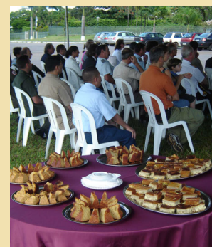
Degustação de produtos do Cerrado durante o plantio de mudas nativas

O programa, coordenado pelo Ministério do Meio Ambiente, tem a parceria da Embrapa Cerrados.